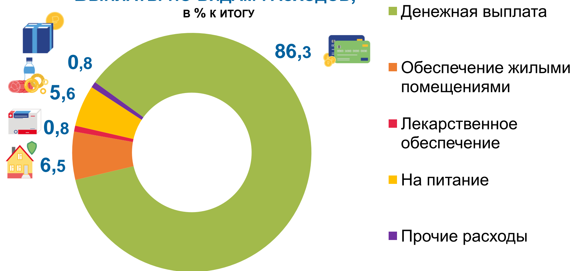
МЕРЫ ПОДДЕРЖКИ ДЕТЯМ И СЕМЬЯМ С ДЕТЬМИ В 2017-2021 ГГ., МЛН РУБЛЕЙ